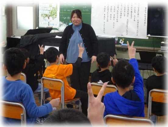
指で表す ①の旋律は① ②の旋律②