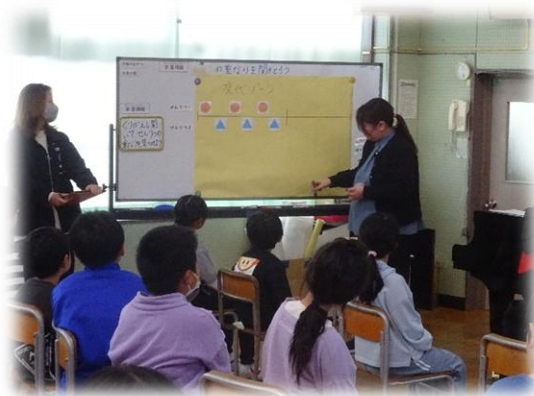
2つの旋律のあらわれ方、重なり方について視覚で確認し、何を学んだのかおさえている場面