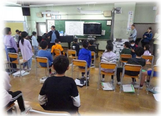
旋律① 旋律②のグループで、自分の担当の旋律が流れたら、立つ